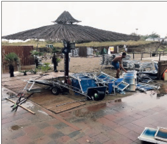
Il maltempo ha colpito anche Rosolina

“Tuttavia - prosegue l'assessore - non possiamo non pensare che per fortuna i danni sono stati solo materiali e non alle persone. Come amministrazione comunale abbiamo cercato, sin da subito, di essere vicino alla nostra gente e alle centinaia di turisti che hanno vissuto questa terribile esperienza. Ora arriva la parte burocratica di gestione e anche se so bene che è la più impegnativa,