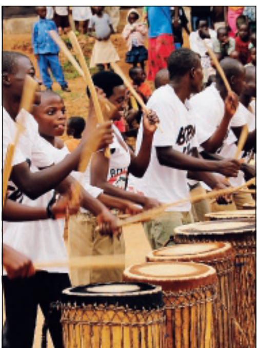
Evento benefico per aiutare i giovani del Rwanda

ALBARELLA (Rosolina) - Fondazione Marcegaglia organizza un grande evento benefico: “Future for Rwanda” nella splendida Isola di Albarella. Personalità di spicco del mondo dell'imprenditoria si daranno appuntamento il 16 e il 17 settembre: alla solidarietà si uniranno divertimento, relax e occasioni di networking per vivere una due giorni indimenticabile.